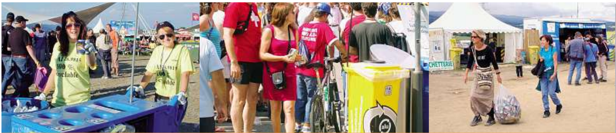
Guadagnare soldi con le lattine d'alluminio vuote durante le manifestazioni.