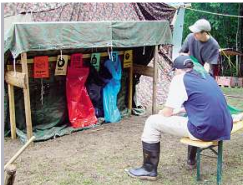
Punto di raccolta di materiali riciclabili nel campo scout.

■ Altre informazioni sulla campagna degli scout agli indirizzi www.igora.ch e www.petrecycling.ch