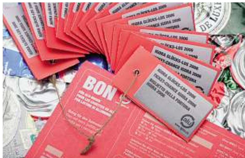
Ogni anno 30 000 biglietti vincenti per i solerti raccoglitori di alluminio.

1° premio (3000 franchi) Orient Konzert, Film & Theater GmbH, 8200 Sciaffusa 2° premio (1500 franchi) Motion GmbH, 7131 Luven 3° premio (500 franchi) ristorante Tara Take Away, 6020 Emmenbrücke