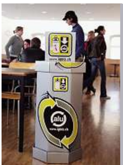
Il box per la raccolta di alluminio fa furore

Materiale cartone Peso 4 chili Diametro 47 cm Altezza 85 cm Contenuto fino a 170 lattine d'alluminio usate