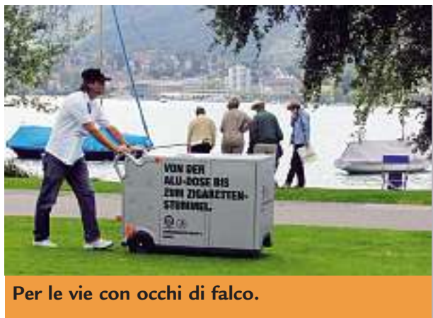
Per le vie con occhi di falco.

Attribuisco questo atteggiamento aperto alla mia infanzia, alle origini di una grande famiglia tradizionale glarone. Trascorsi infatti l'infanzia a Glarona insieme ai miei sette fratelli. I rifiuti rappresentano per me una realtà quotidiana, visto che sin da piccolo appresi che i rifiuti