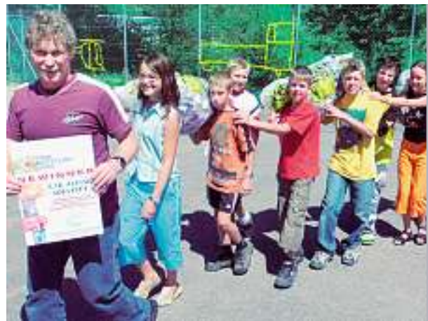
Scolaresca di Hofstatt LU: nessuno nasce maestro nella raccolta dell'alluminio.