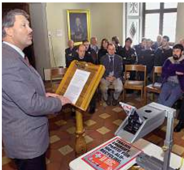
Bruno Gallati, sindaco di Näfels e deputato al Gran Consiglio del cantone di Glarona, durante il saluto ufficiale.