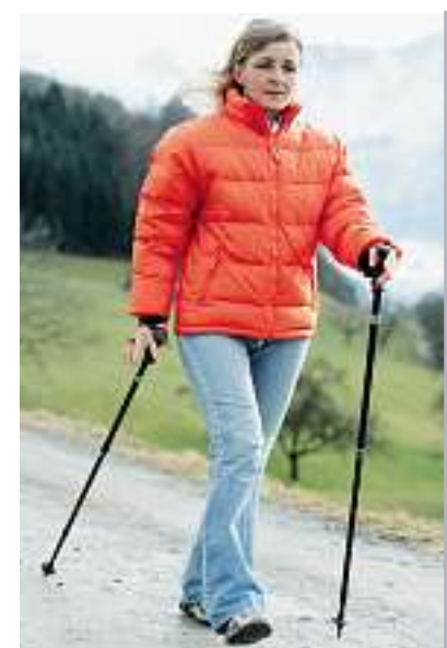
Walking: sportivi e alla moda con l'alluminio.

■ Ordinate subito. L'offerta è limitata a 150 pezzi. Vedi cartolina di risposta qui accanto..