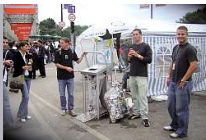
En Hongrie, on est content de la presse-canettes suisse.

■ Plus d'informations: http://aluminiumitaldoboz.hu