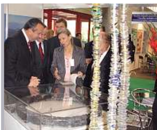
Des ministres hongrois s'étonnent du nombre d'activités.