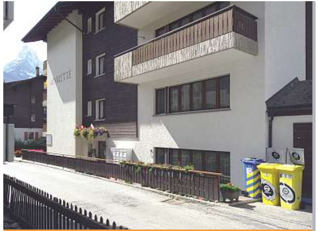
Conteneur IGORA de la résidence de vacances Alouette à Zermatt.