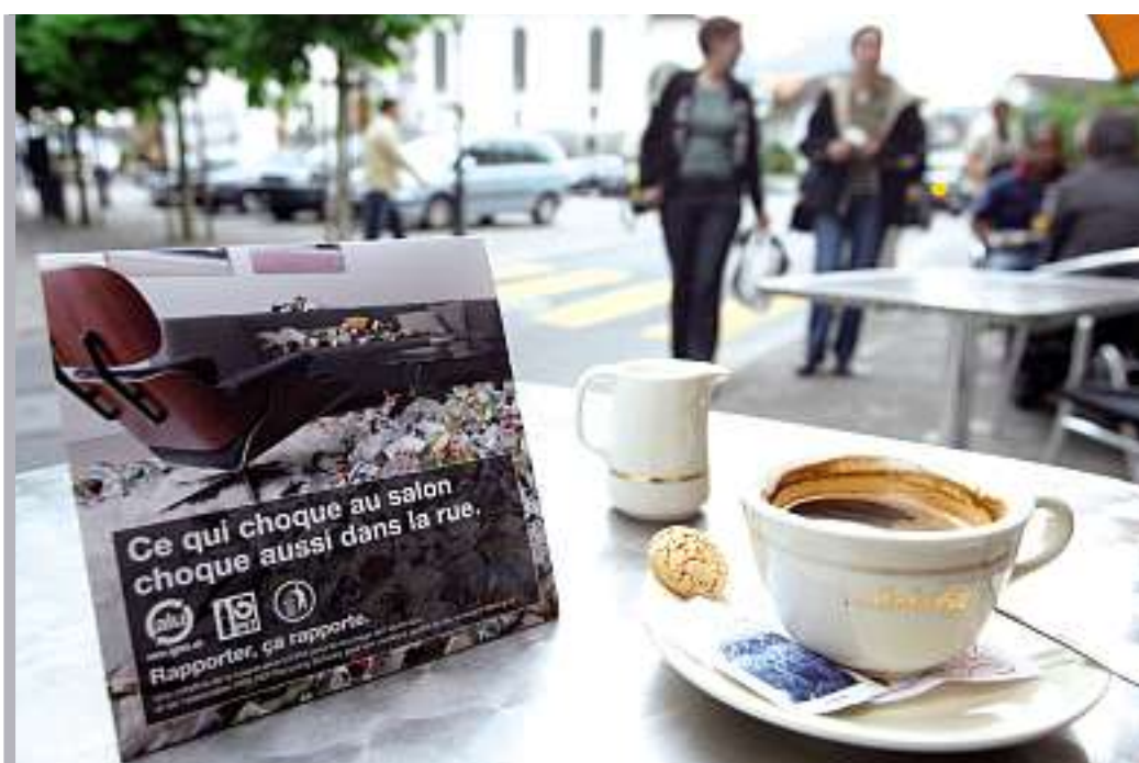
Rotaires, chevalets de comptoir et affiches pour la lutte contre le littering.

Urs Capaul, responsable environnemental de la ville de Schaffhouse, a commandé en collaboration avec plusieurs restaurants plusieurs sets d'affiches afin de sensibiliser, avant tout les jeunes. Il ne peut pas encore présenter de résultats chiffrés, mais est persuadé que l'offensive d'information qui couvre la Suisse entière est d'un grand secours pour les communes et les villes.