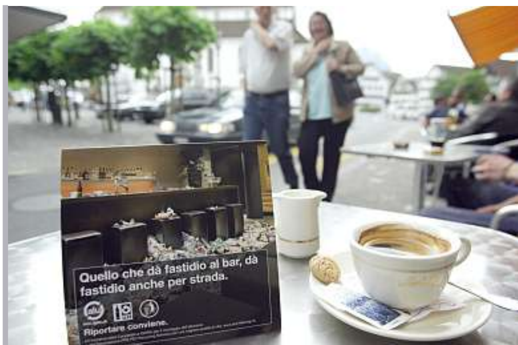
Rotair, presentatore per bancone e manifesti nella lotta contro il littering.