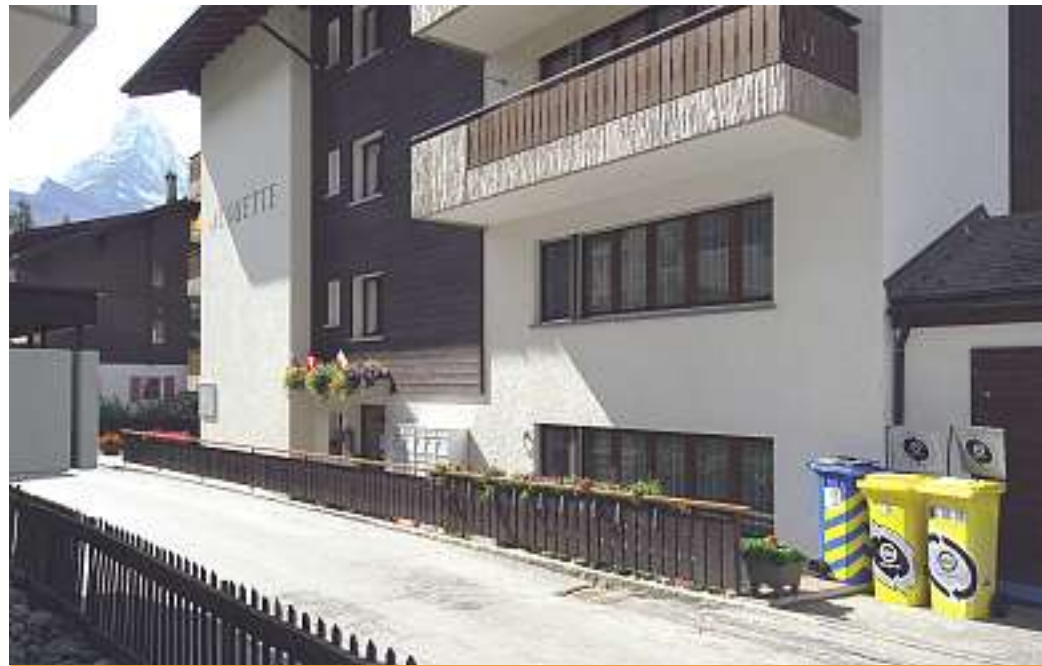
Contenitore per la raccolta di IGORA nella casa di vacanza Alouette a Zermatt.