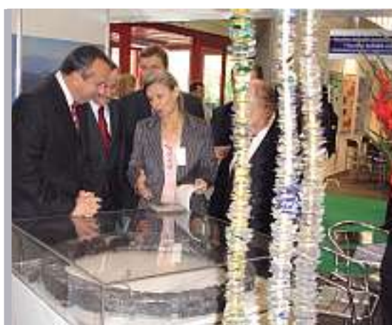
Ministri ungheresi ammirano le varie attività.