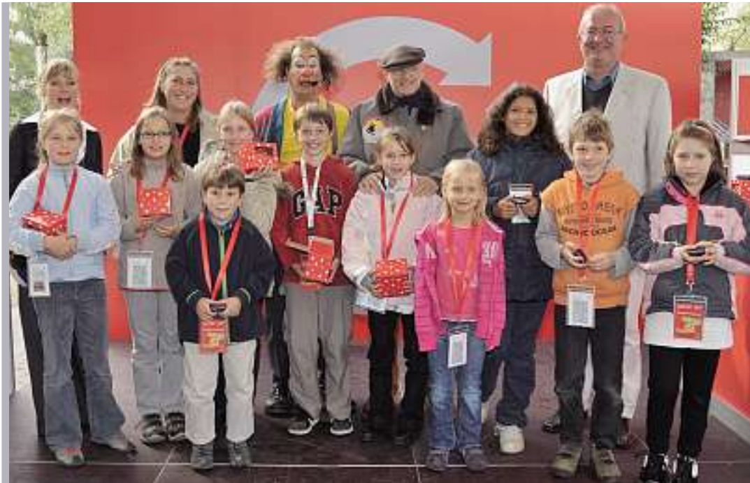
Des enfants ravis sur le podium des gagnants.

Le journal pour tous ceux qui ramassent les emballages vides en aluminium