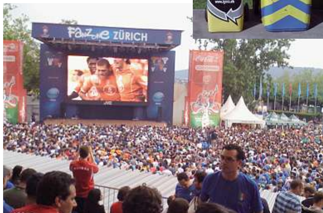
Les fans de foot sont des collecteurs d'aluminium: 7000 kilos ont été collectés dans les villes hôtes et les UBS ARENA.