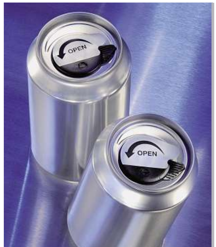
Top moderne et plus confortable: la canette en aluminium avec son couvercle refermable.