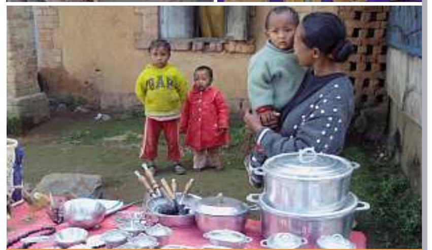
Un véritable artisanat: des marmites et objets artistiques en alu.

Prix-Alurecycling 2008 pour les communes/villes et associations de gestion des déchets