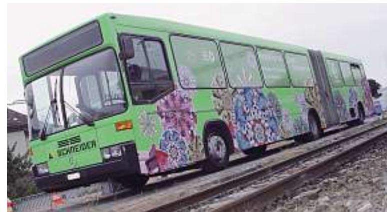
Bus de recyclage: Il n'y a pas si longtemps, il transportait des personnes. Aujourd'hui, les sièges ont cédé leur place aux conteneurs.

■ Les habitants de Stäfa et de Küsnacht sont reconnaissants envers la firme Frères Schneider SA. Ils continuent à se rendre chaque semaine à l'arrêt du bus de recyclage. Et quand on n'a vraiment rien à recycler? Il y a alors là au moins l'occasion idéale de bavarder allègrement.