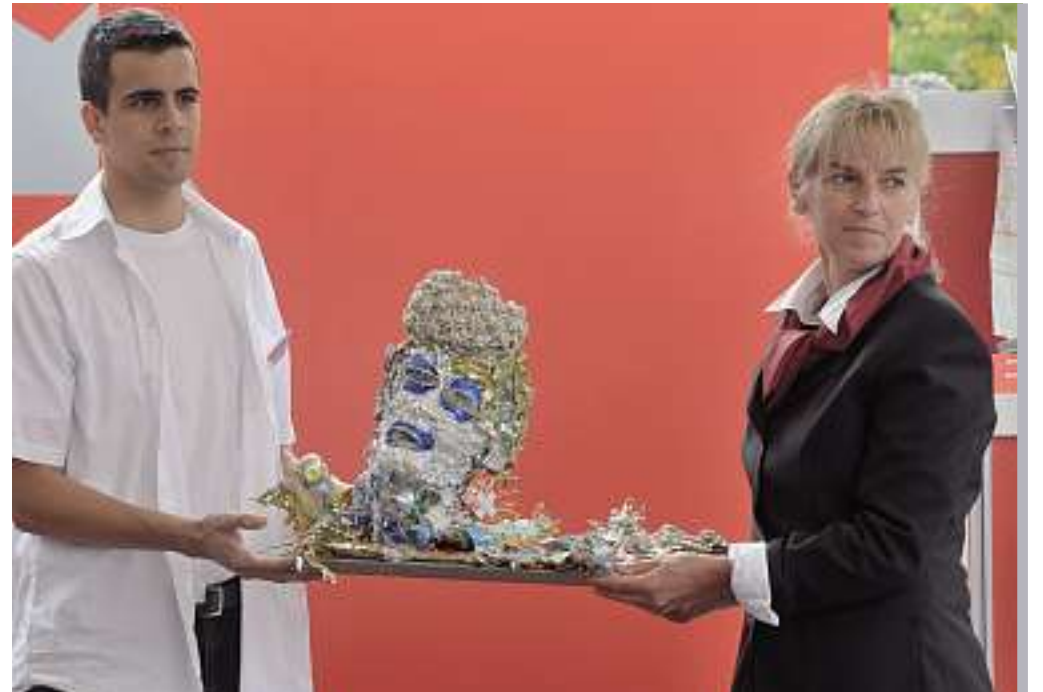
Un objet artistique cherche acheteur lors de la vente aux enchères.