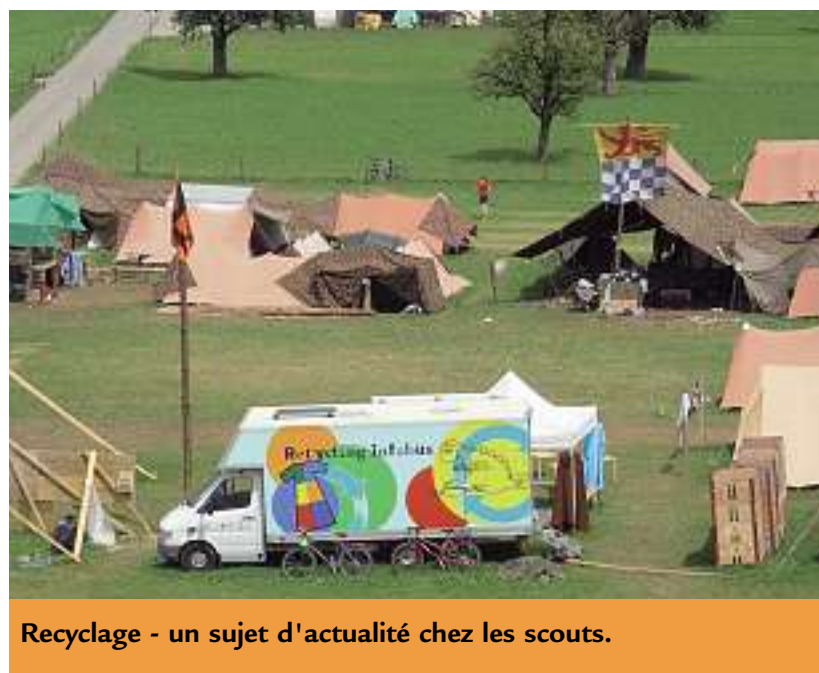
Recyclage - un sujet d'actualité chez les scouts.

Avec l'argent des prix, les scouts peuvent maintenant agrandir leurs tentes – car le prochain camp est bientôt là!